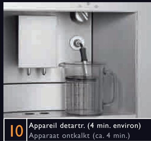
10 Appareil detartre. (4 min. environ) Apparaat ontkalkt (ca. 4 min.)