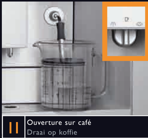
11 Ouverture sur café Draai op koffie