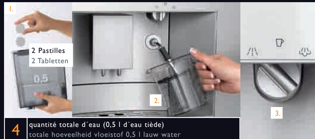
4 quantité totale d'eau (0,5 l d'eau tiède) totale hoeveelheid vloeistof 0,5 l lau water