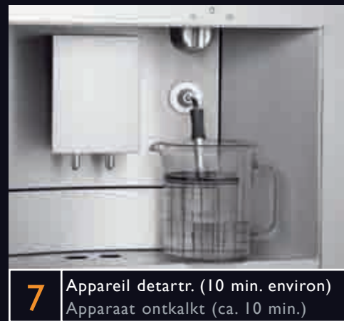
7 Appareil detartre. (10 min. environ) Apparaat ontkalkt (ca. 10 min.)