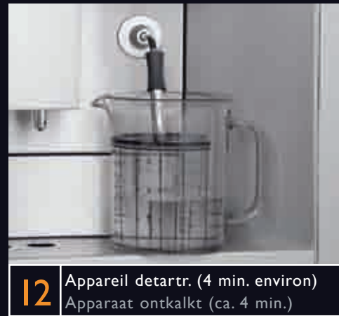
12 Appareil detartre. (4 min. environ) Apparaat ontkalkt (ca. 4 min.)