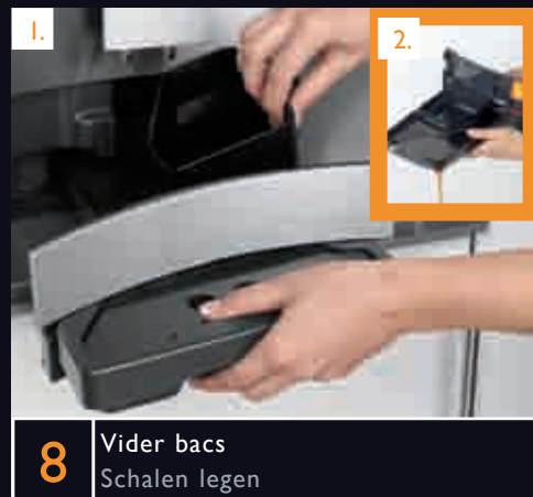
8 Vider bacs Schalen legen