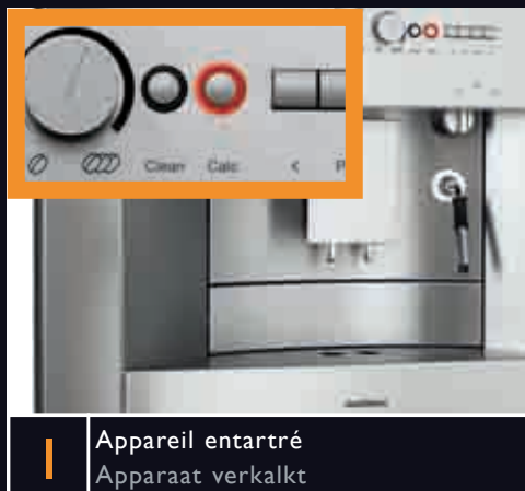
1 Appareil entartre Apparaat verkalkt