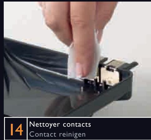
14 Nettoyer contacts Contact reinigen