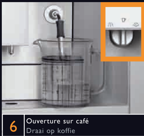
6 Ouverture sur café Draai op koffie