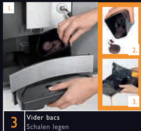
3 Vider bacs Schalen legen