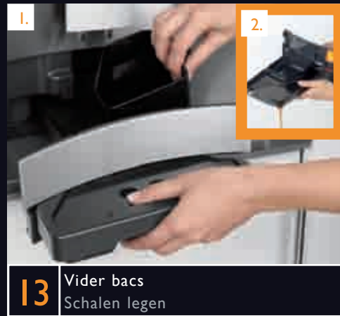
13 Vider bacs Schalen legen