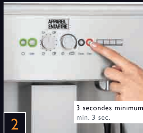
2 3 secondes minimum min. 3 sec.