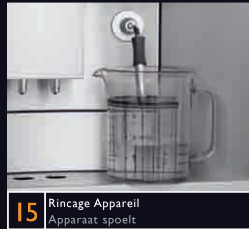
15 Rincage Appareil Apparaat spoelt