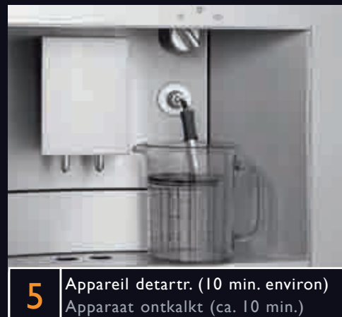
5 Appareil detartre. (10 min. environ) Apparaat ontkalkt (ca. 10 min.)