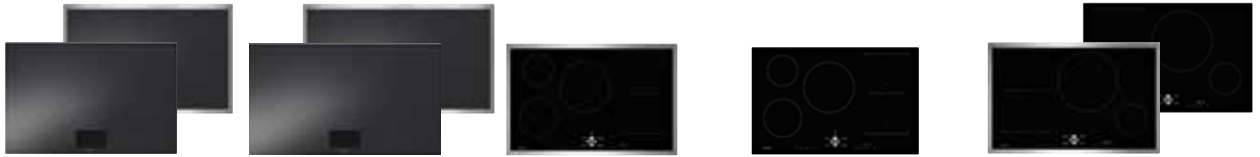
LEVERBAAR MEDIO APRIL 2019. Opvolger van de CI 283 111.